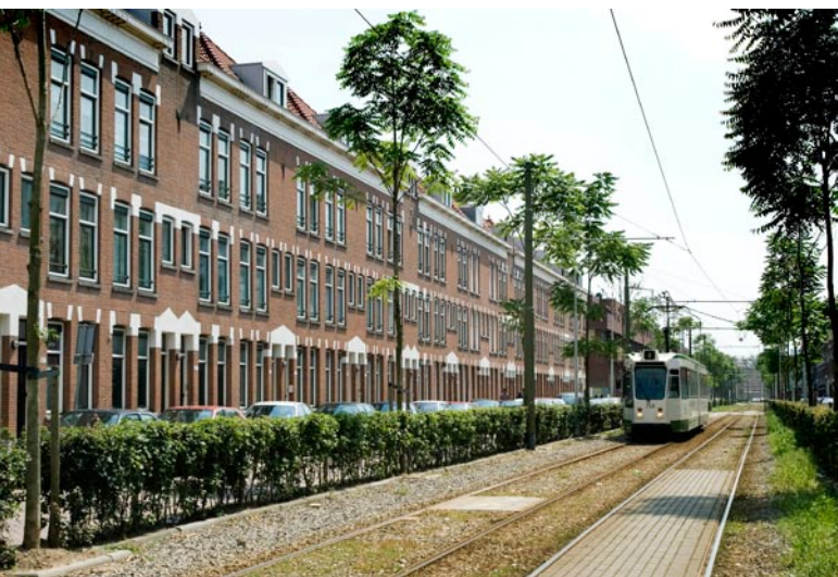
Ook woningen in de Spanjaardstraat in Rotterdam zijn van Com•Wonen.

belangrijk dat we een hogere mate van stabiliteit en continuïteit aan onze interne medewerkers kunnen bieden door overal over te gaan op glas”.