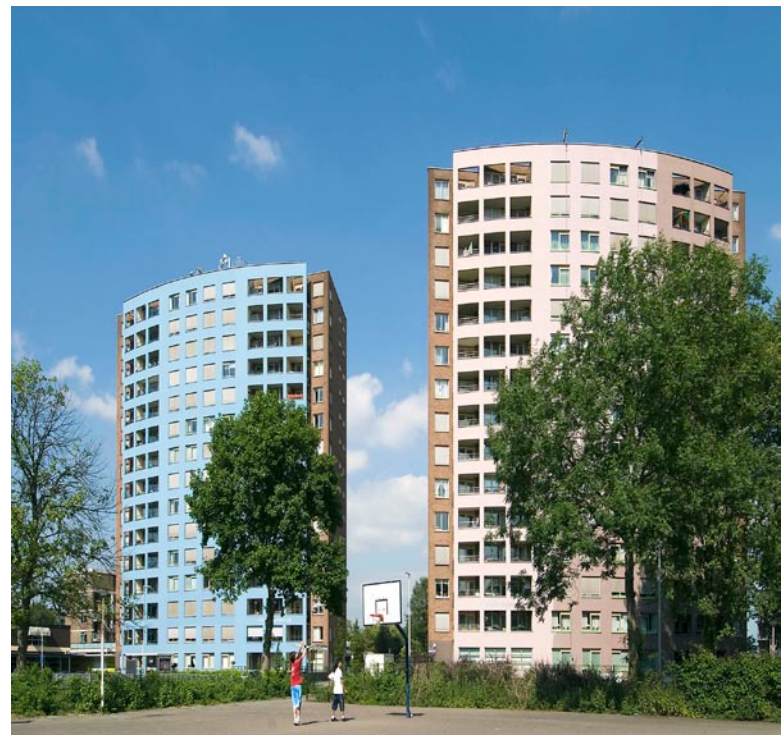
Tibulushof in Rotterdam, een van de wooncomplexen van Com•Wonen.

'Wij zijn bij dit unieke initiatief aangehaakt vanwege onze toenemende behoefte aan meer bandbreedte. Door de vraagbundeling kan tegen gunstiger tarieven worden voorzien in onze gezamenlijke vraag. Naast een kostenbesparing is tevens sprake van een verdere kwaliteitsverbetering van de dataverbindingen tussen regiokantoren en hoofdkantoor en daarvan profiteren niet alleen onze medewerkers, maar - indirect - ook onze klanten. Kortom, samen staan we sterker!'